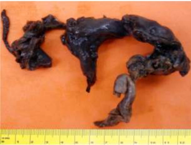
Figura 1. Imagen macroscópica de quiste paraovárico derecho en preparación de formol.