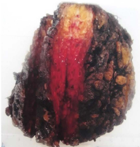
Figura 3. Espécimen patológico.

Descripción microscópica: Números vasos sanguíneos venosos, dilatados, tapizados por endotelio sin atipia, con trombos y material de cuerpo extraño en su interior (embolización previa) rodeados por un estroma congestivo, con ligero infiltrado inflamatorio linfocitario. No se observa malignidad, lesión correspondiente a malformación arteriovenosa