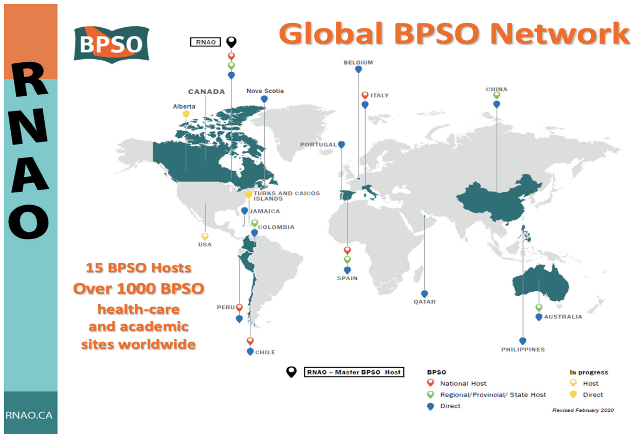
Figura 2. Mapa de la red de centros BPSO mundial.

primaria, atención hospitalaria, atención domiciliaria, residencias de la tercera edad, etc.). Actualmente existen 881 Centros Comprometidos con la Excelencia en los Cuidados (BPSO, por su sigla en inglés) en todo el mundo, como ilustra la Figura 2. Este enfoque permite obtener datos fiables para la evaluación y la comparación de resultados en organizaciones similares. Los BPSO tienen la opción de renovar su acuerdo después de completar satisfactoriamente su primer acuerdo de 3 años. Cada renovación es por 2 años adicionales durante los cuales se comprometen a la difusión continua de las guías existentes, la adopción de dos nuevas guías y la evaluación de su impacto en los resultados.