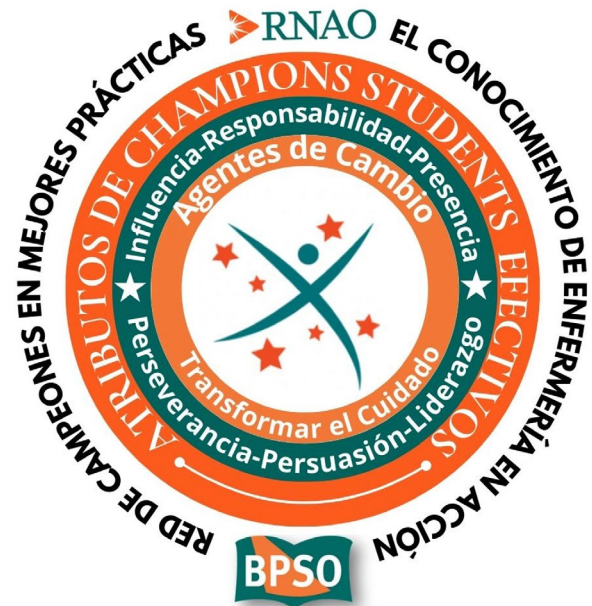
Figura 1. Modelo Red Champions Students BPSO

Los Champions BPSO de la RNAO son personas que apoyan el uso de las Guías de Buenas Prácticas (GBP) y otros recursos basados en evidencia para mejorar la práctica clínica y la toma de decisiones, crean conciencia sobre las GBP, apoyan la comprensión e influyen en su adopción entre los compañeros de trabajo. De acuerdo a lo anterior, son merecedores de los siguientes atributos en sus equipos de trabajo: influencia, responsabilidad, presencia, perseverancia, persuasión, con un estilo de liderazgo participativo (5) (Figura 1).