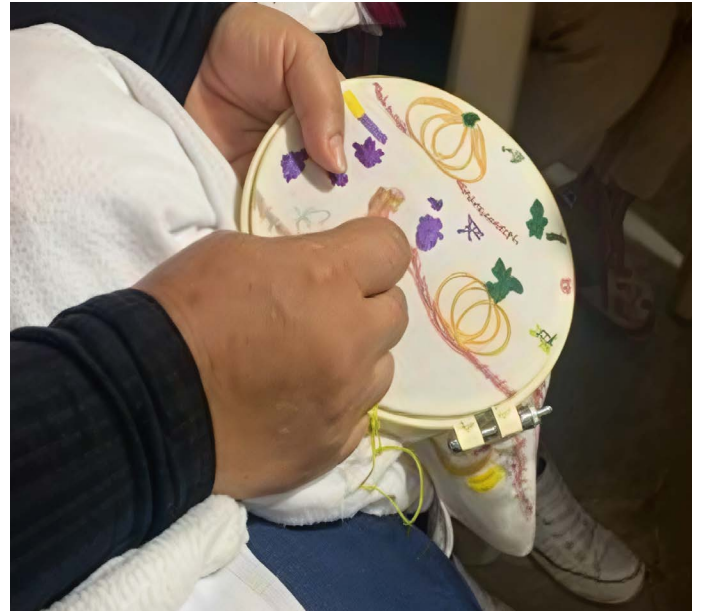
Figura 2. Bordando sueños