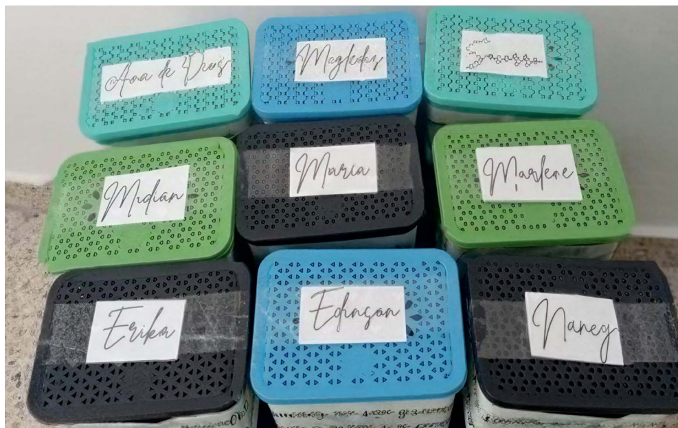
Figura 3. La caja de los sueños

Una de las actividades de cohesión fue nombrada por los participantes como “La caja de los sueños” (Figura 3).