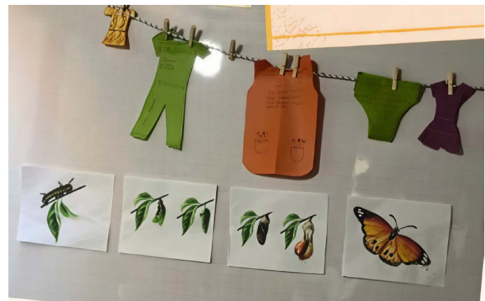
Figura 7. La oruga y la mariposa

Se trabajó en la construcción de confianza, que es poder estar con los otros y tenerles fe. De ahí el interés por valorar el diario íntimo y cómo la narrativa personal aporta al conocimiento de la vivencia comunitaria. Se trabajó la metáfora de la oruga y la mariposa (Figura 7). La importancia de afrontar las transformaciones en el modo de pensar y ser. La oruga es un momento importante. Las acciones dirigidas al reposo de la crisálida son una intensa actividad interna que no cesa hasta el florecimiento de una mariposa. Hablaron de las dificultades como esos pasos lentos y pesados de la oruga. Ante lo que parecía sin salida, cada quien tuvo un aleteo para experimentar las cosas de otra manera. En ese momento hubo un instante de “serendipia” o de feliz coincidencia. En medio de la reflexión, una mariposa monarca atraviesa la sala. Esta fue la señal de que era necesario armarse de entusiasmo, paciencia y trabajo perseverante, que las metas se van realizando, y que la vida es transformación.