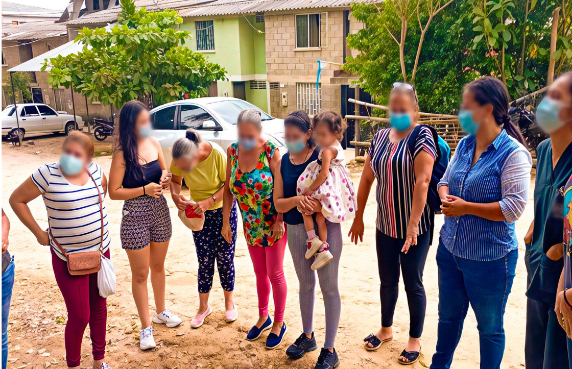
Figura 4. Quemar recuerdos

pasado, y así poder perseverar y superar obstáculos. El ritual de quemar permitió darle un lugar distinto al pasado, sin olvidarlo, tomándolo como base de un comienzo. El símbolo fue “renacer de las cenizas” y con el fuego se iluminó esta nueva oportunidad (Figura 4,5).