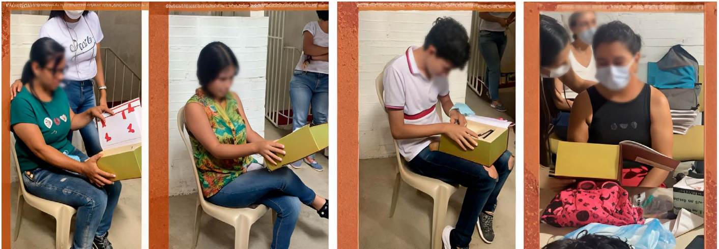
Figura 6. La caja mágica

los participantes describir su contenido. En la caja había un espejo de aumento que los sorprendió. Contaban que veían dolor, deseos de vivir y oportunidades. También sentían vergüenza, incertidumbre y el firme propósito de reflexionar sobre las historias que habían tejido en Nuevo Girón. Ese momento revelador sucedió sin la fascinación que en algunos puede producir escuchar el dolor del otro. Algunos estudiantes e investigadores acompañaron este proceso y compartieron su experiencia ante “la caja mágica” (Figura 6). Apareció lo interesante de pensar la vida como una autoetnografía en la posibilidad metodológica de leer la sociedad a través de una biografía (20). Se reflexiona sobre el desarrollo de capacidades, el conocimiento de sus derechos como ciudadanos y constructores de cambio.