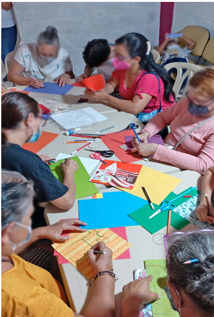
Figura 8. Tendedero

Fue importante acompañar la manera en que los deseos se construyen para que no sean ideales inalcanzables, deudas, culpa y depresión. Alguien propuso: “ningún soñador es pequeño y ningún sueño es demasiado grande”. Elaboraron la silueta de una prenda, y en ella escribieron sus anhelos y cómo alcanzarlos. Se realizó un “tendedero” (Figura 8,9) que se fue llenando de iniciativas y de temores reflejados en dichos: “de sueños no se puede vivir”, o “ahora todo el mundo vende pijamas”. Concluyeron que cuando se alimentan los obstáculos no hay lugar para el deseo.