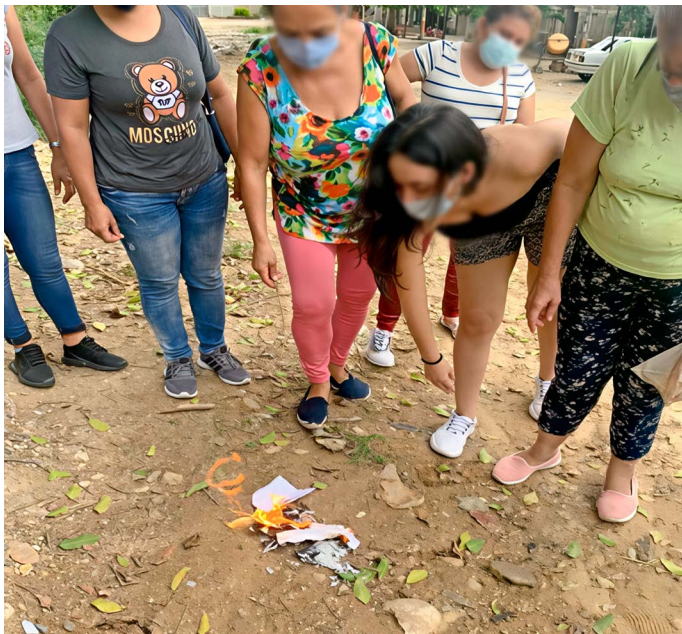
Figura 5. Quemar recuerdos

En la cajita guardaron los signos y herramientas de su nuevo proyecto. “El dechado” que según la Real Academia Española (RAE) (18) es “un modelo para imitar”, en este caso fue el depositario de la perseverancia, pues en la tela quedaban los intentos de volver a empezar y la paciencia para lograr un fino bordado. Cuando se fue completando el dechado, se abrió la posibilidad de gestionar entre universidad y comunidad, la alianza con una empresa de bordado a mano llamada Bordino . Después de pruebas de calidad varios lograron contratos de trabajo y solicitudes pagadas por tarea (Tabla 2).