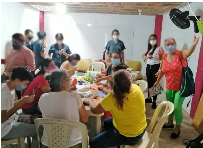
Figura 12. El pañal