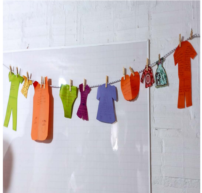
Figura 9. Tendedero

Una mujer que pensaba tener todo solucionado, afirmó: “nunca imaginé llegar a un cursito de capacidades para crear el trabajo”. Perdió a su esposo en la pandemia, quedó sin saber qué hacer. Entendió que es el momento para forjar oportunidades. Quiere que sus hijos la vean salir adelante. Diseñó una ruana porque necesita abrigo, se siente sola, abandonada por su esposo (Figura 10).