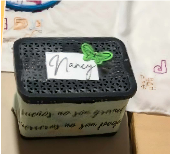
Figura 1. Bordando sueños

del tejido subjetivo y social. Para una participante se trataba de “tener un arte para no aguantar hambre”, dejar el rebusque y trabajar desde casa. Esto aborda aspectos importantes para la dignidad: la casa, el trabajo, el arte. Ospina (17) decía con Picasso: “Para mí una casa es un taller o no es nada”. No es lo mismo tener la posibilidad de estar en el hogar con sus hijos y trabajando, que exponerse en la calle.