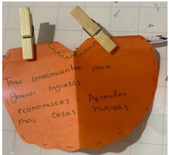
Figure 10. The ruana

Una mujer que pensaba tener todo solucionado, afirmó: “nunca imaginé llegar a un cursito de capacidades para crear el trabajo”. Perdió a su esposo en la pandemia, quedó sin saber qué hacer. Entendió que es el momento para forjar oportunidades. Quiere que sus hijos la vean salir adelante. Diseñó una ruana porque necesita abrigo, se siente sola, abandonada por su esposo (Figura 10).