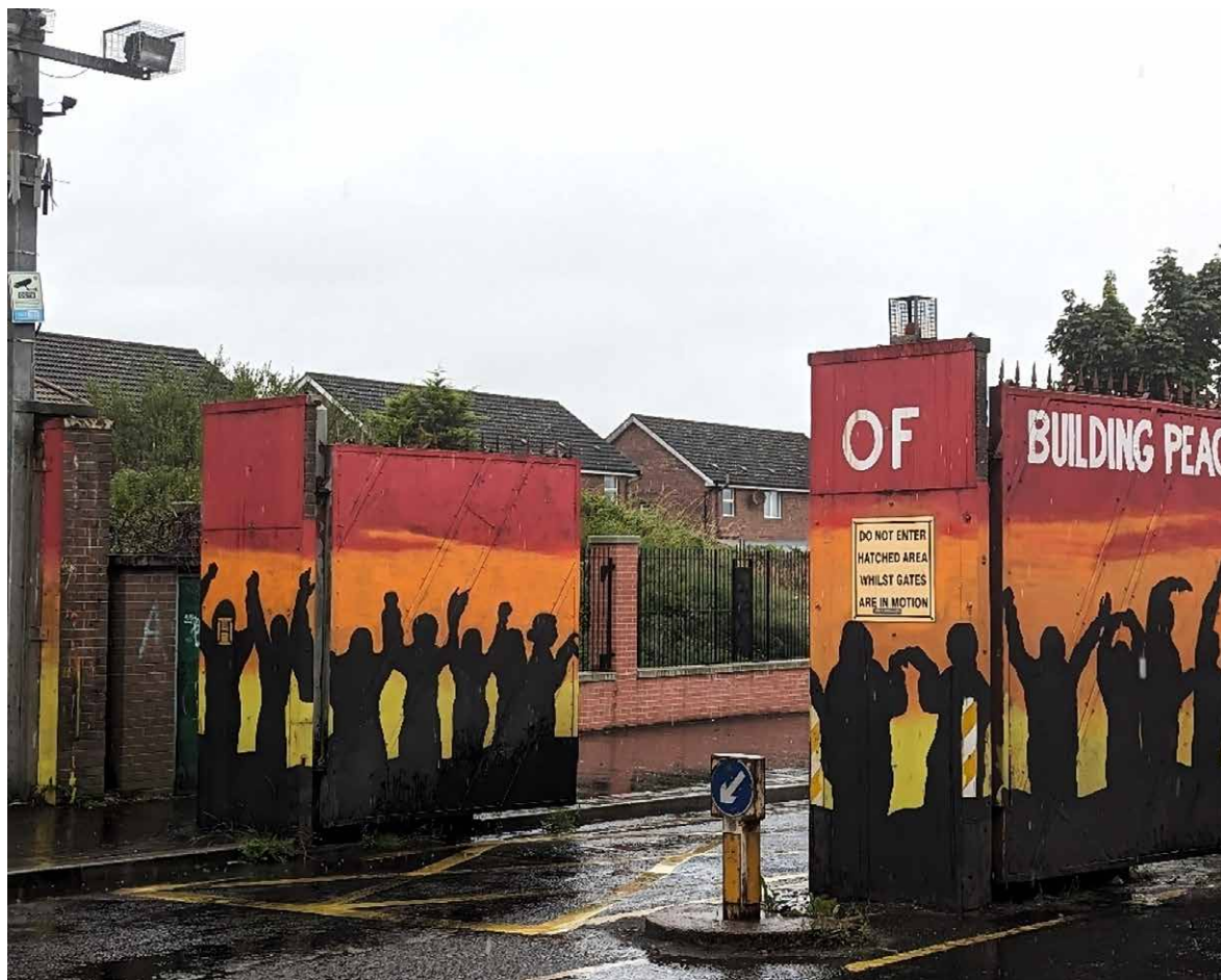
Figura 3. Puertas del Muro de la Paz en Lanark Way, en el oeste de Belfast

Fuente: foto de la autora, 12 de agosto de 2024.