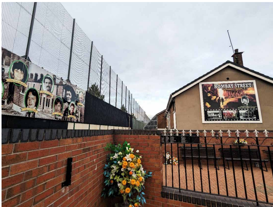
Figura 1. Muro de paz junto con el mural Never Again! en el Clonard Martyrs Memorial Garden de Bombay Street-Cupar Way